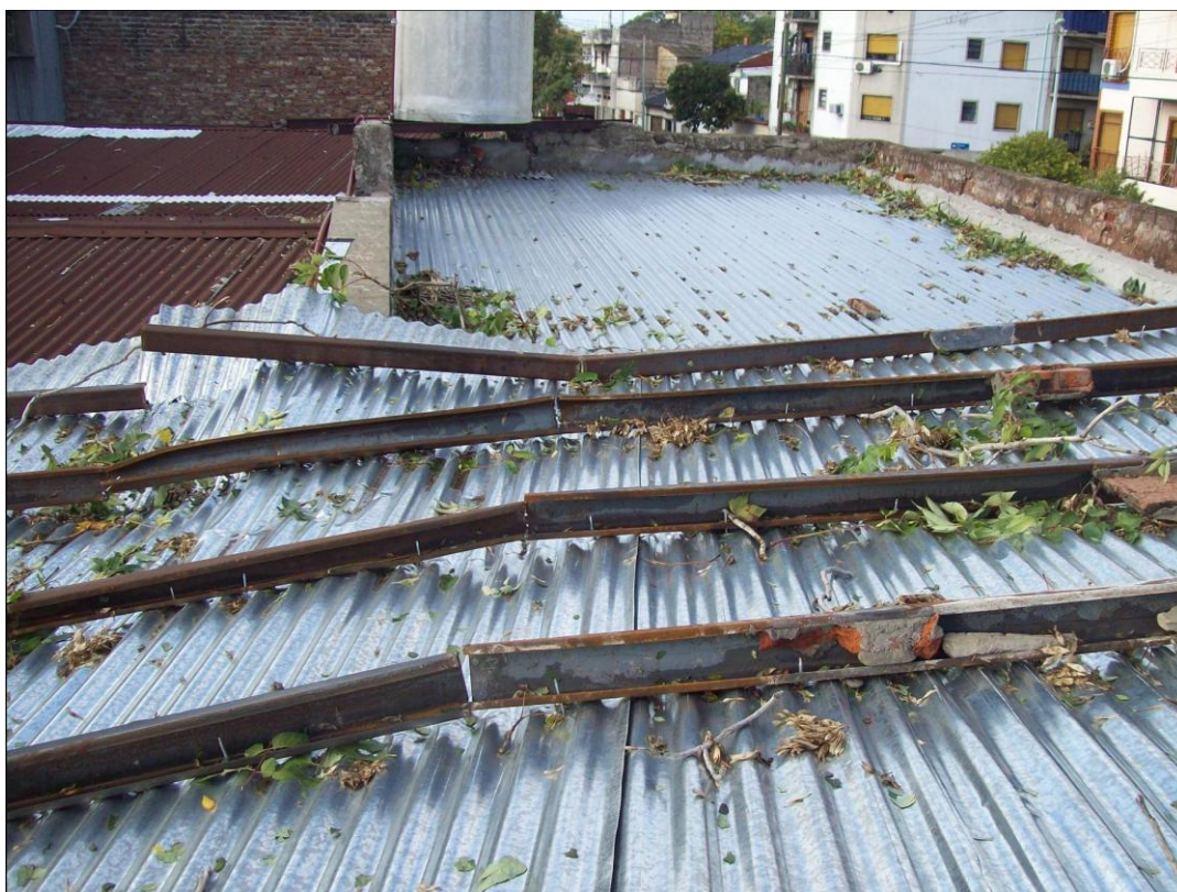
Restos del techo (Caído al revés: se ven las vigas torcidas y/o partidas)

El sector donde funcionan los vestuarios se quedó sin techo, pues el mismo fue arrancado íntegramente por efecto del viento. El personal encaró las tareas básicas de refacción.