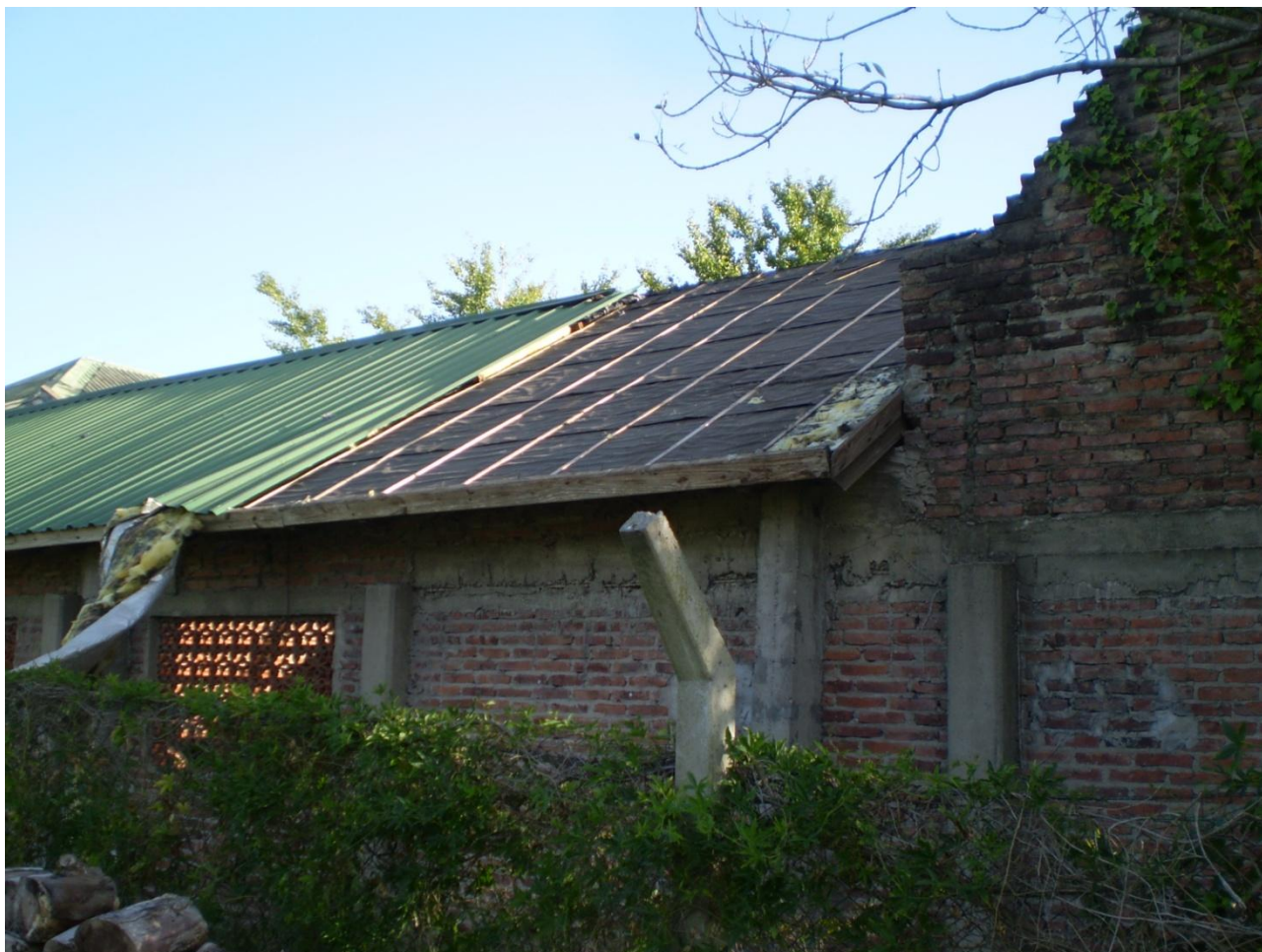
Techo Hogar Sacerdotal – Cottolengo Don Orione de Claypole

Al mismo tiempo, el Hogar Sacerdotal, donde residen los curas responsables del funcionamiento del Cottolengo como así también los más ancianos y enfermos, vio como parte de un techo de chapas de 9 m 2 se “levantó y voló” más de 10 metros, con tirantes incluidos.