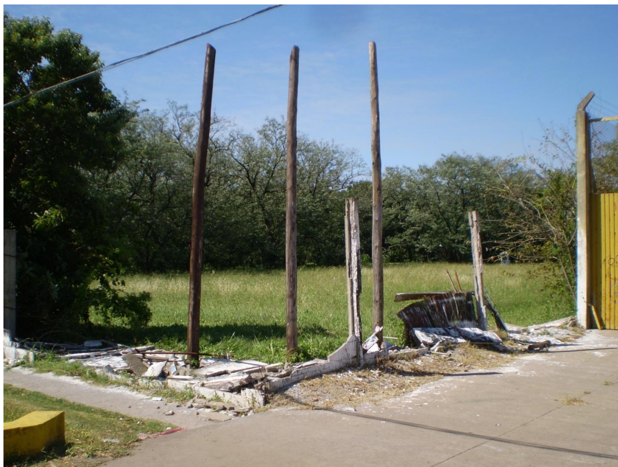
Muro Perimetral (Sección Monteverde) – Cottolengo Don Orione de Claypole

Por otra parte, el muro perimetral del Pequeño Cottolengo, ubicado sobre Avenida Monteverde, fue literalmente “derribado” en una extensión de 20 metros (un bloque entero), haciendo vulnerable a la institución y requiriendo un refuerzo en la seguridad (con el consecuente costo) para evitar la intrusión, pero principal y fundamentalmente el riesgo de que los residentes (personas con discapacidad física y/o mental) puedan salir del Cottolengo sin acompañamiento, con el consiguiente peligro para ellos.