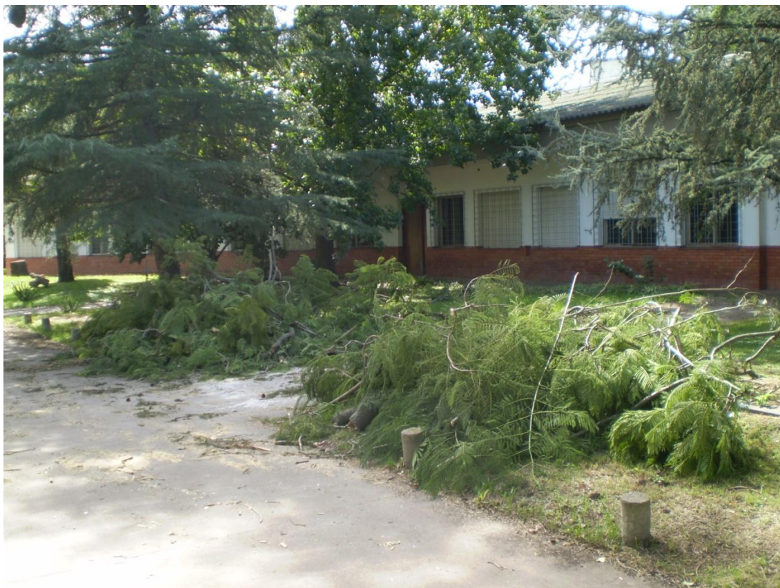
Daños del temporal en las calles internas – Cottolengo Don Orione de Claypole