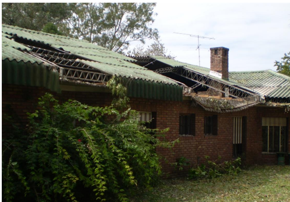
Hogar Ambrosio Tognoni – Cottolengo Don Orione de Claypole

Sin dudas, para la Obra Don Orione es una pérdida cuantiosa, pero sobre todo dolorosa por el esfuerzo invertido en la alegría de los abuelos de tener su casa nuevamente linda.